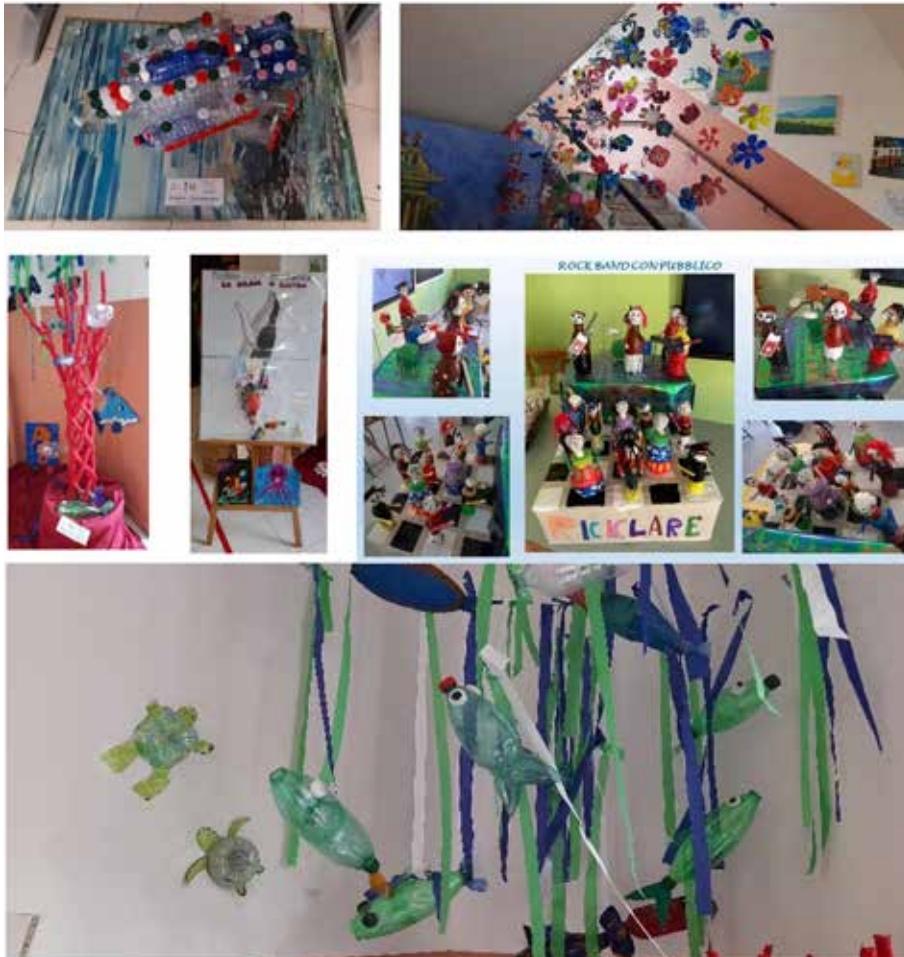
Figura 10 Installazioni prodotte dagli studenti

Durante l'evento è stato possibile esaminare gli elaborati/installazioni realizzati dagli studenti e relativi alla tematica trattata (fig. 10). La risposta degli alunni è stata entusiasta: con l'aiuto dei tutor didattici, i più piccoli, hanno realizzato diversi lavori sul tema del riciclo e del rispetto dell'ambiente, tra cui la canzone "Riciclamo" (fig. 11), e una band musicale con il pubblico che segue il concerto con plastica riciclata.