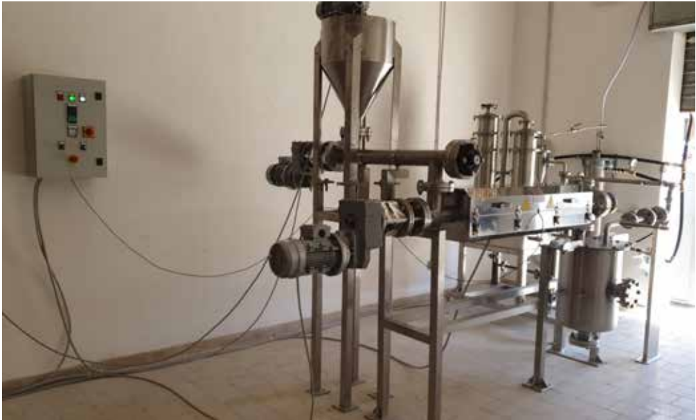
Figura 4 Impianto di pirolisi PescaPlastica

materiale che è stato fornito gratuitamente in bidoni da 2 litri agli operatori della pesca presenti (fig. 4).