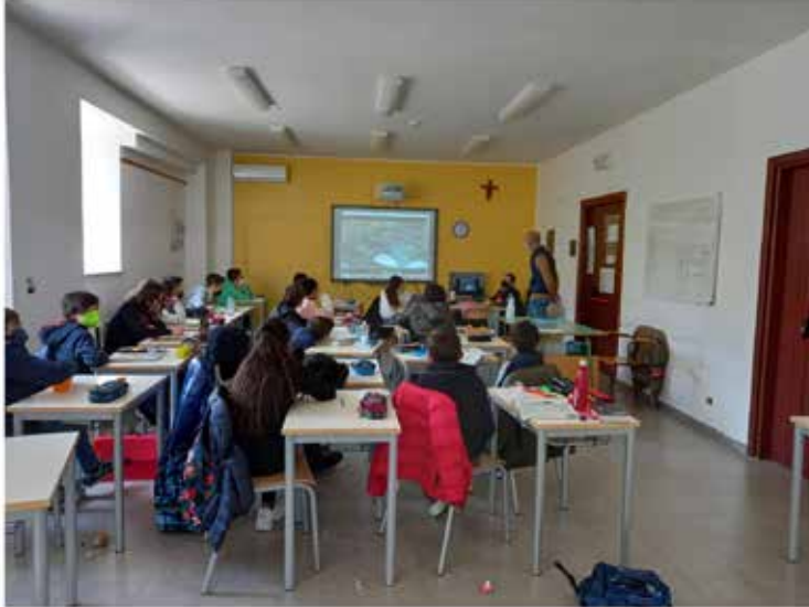
Figura 7 Attività nelle scuole della provincia di Agrigento