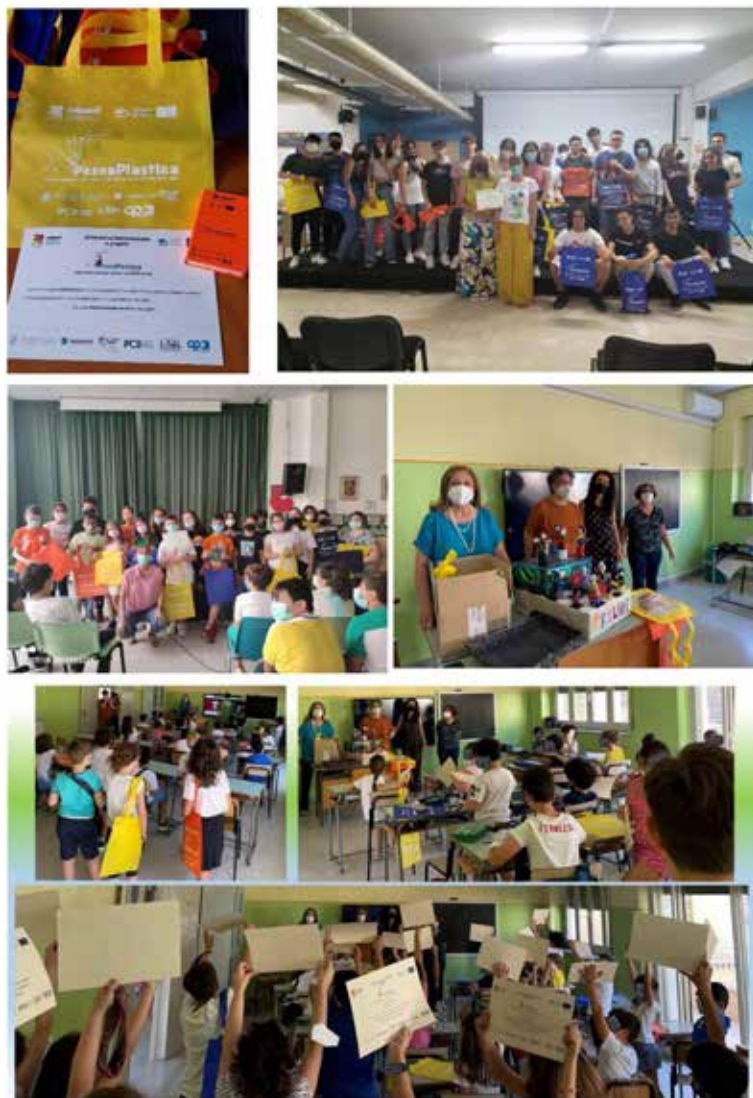
Figura 9 Gadgets realizzati

3.7.5. EVENTO CONCLUSIVO NELLE SCUOLE DEL TERRITORIO E CONSEGNA ATTESTATI DI PARTECIPAZIONE. Per l'evento conclusivo di diffusione e divulgazione del progetto PescaPlastica nelle scuole delle province coinvolte, sono stati realizzati dei gadget da distribuire agli studenti e stampati degli attestati di partecipazione consegnati alle classi coinvolte (fig. 9).