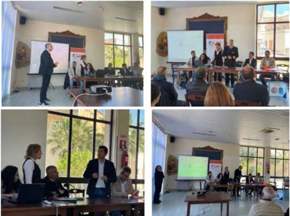
Figura 3 Evento conclusivo del progetto

Così come per l'evento inaugurale, durante l'evento conclusivo, tutti gli interventi sono stati incentrati sull'impatto ambientale, economico e sociale dell'iniziativa, ponendo la necessità di contestualizzare il tutto in un ambito più esteso e quanto più intersecato con la gestione dei rifiuti plastici sia marittimi che da terra ferma (fig. 3).