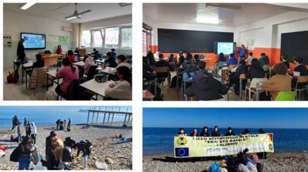
Figura 6 Attività nelle scuole della provincia di Palermo

Viste le restrizioni Covid, alcune attività previste, quali il gioco della raccolta e della differenziazione della plastica, sono state effettuate in modalità virtuale.