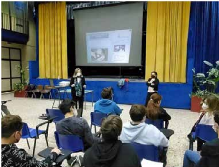
Figura 8 Attività nelle scuole della provincia di Catania