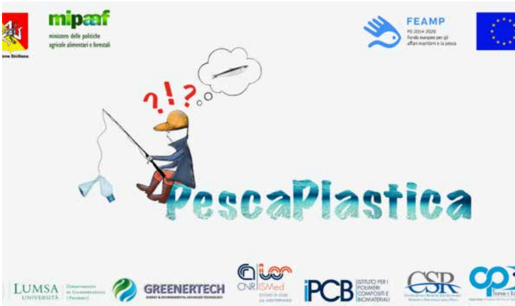
Figura 2 Brand/logo del progetto

3.7.2. ATTIVITÀ WEB E SOCIAL. Sono state create le pagine di diffusione delle attività svolte durante il progetto sui differenti social (Facebook, Instagram, Twitter), canali istituzionali e testate giornalistiche locali qui di seguito elencati: